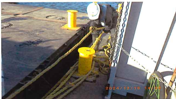
係留ロープの尻手を整理する鶴沼社員