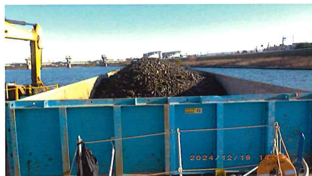
土砂というより岩石