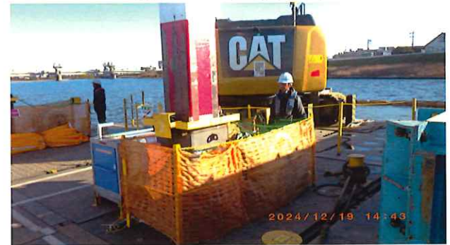
スパットの巻上操作を行う鶴沼社員