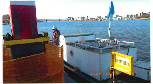
パドリングボート(中央上方)が近接遊泳中