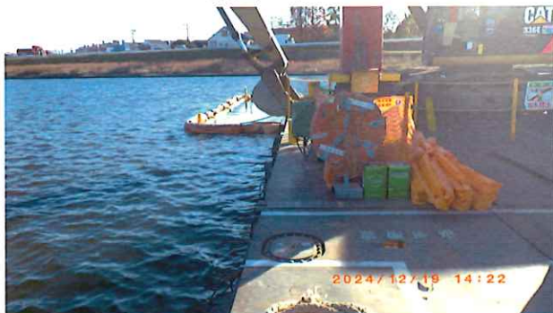
甲板上は整理整頓が行き届いている