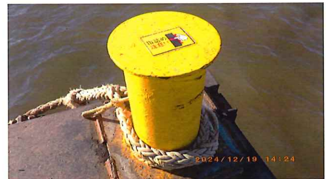
補助ロープと注意喚起表示